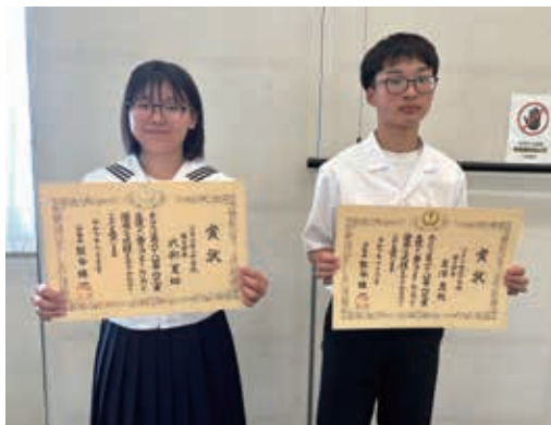
八戸市長賞受賞の二人