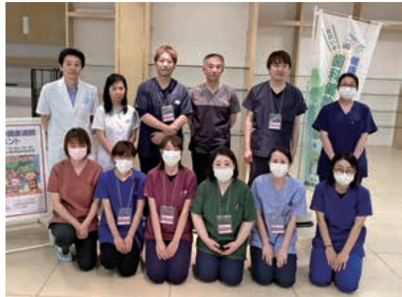
ご協力頂いた先生方とスタッフの方々