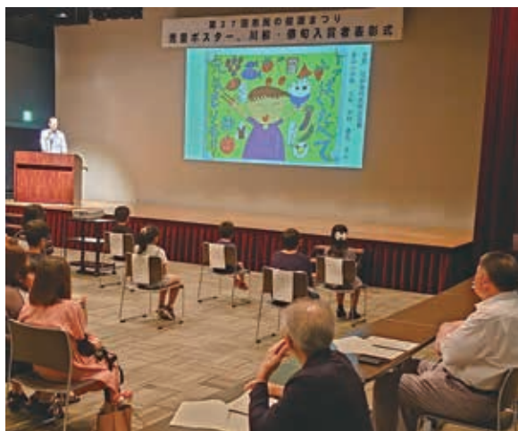
【ポスター部門 弘前歯科医師会会長賞】