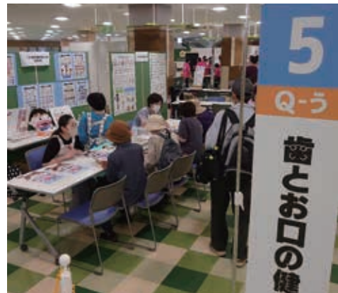
【衛生士会による歯科保健指導】