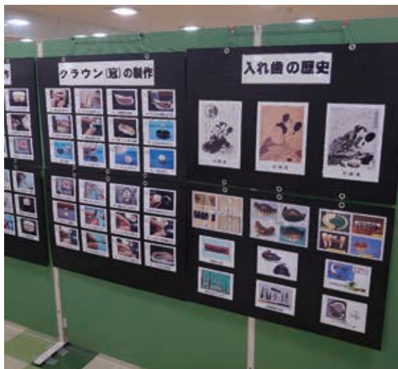
【技工士会パネル展示】