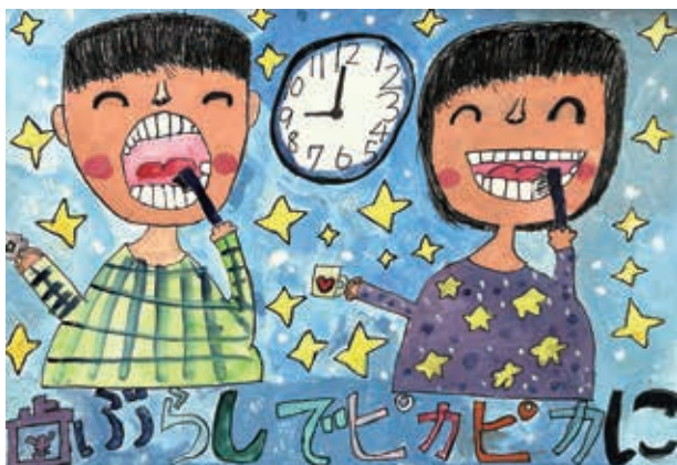
小学校低学年の部特選