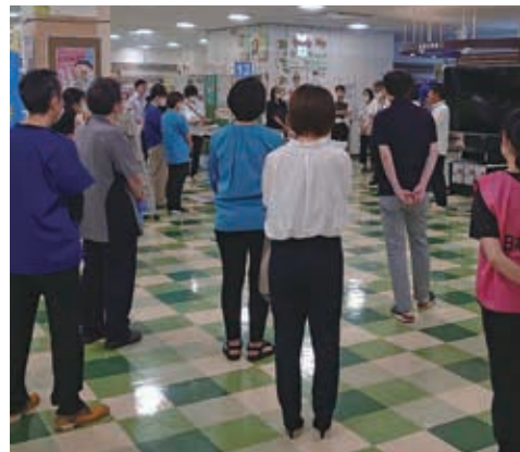
【会場前の最終ミーティング】