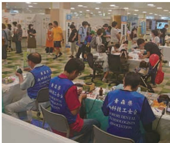
【模型製作体験コーナー 子供たちに大人気！】