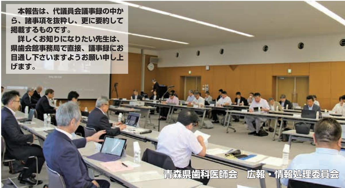
青森県歯科医師会 広報・情報処理委員会

詳しくお知りになりたい先生は、県歯会館事務局で直接、議事録にお目通し下さいますようお願い申し上げます。