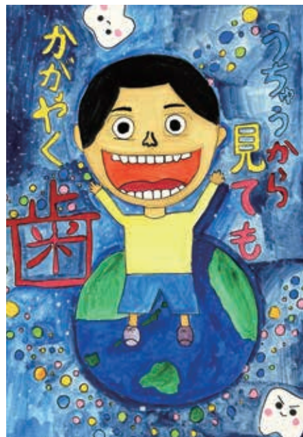
小学校高学年の部特選