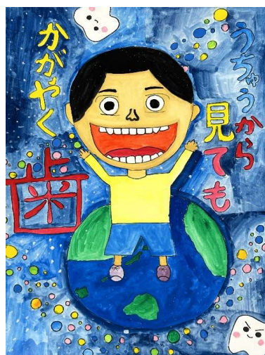
小学校高学年の部