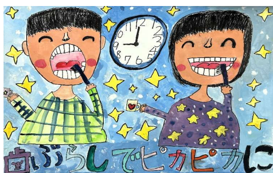
小学校低学年の部